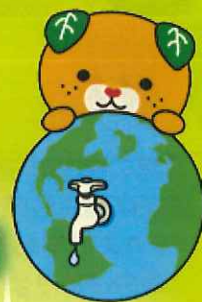
愛媛県イメージアップキャラクター みぎゃん