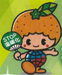
愛媛県地球温暖化防止キャラクター ストッピー